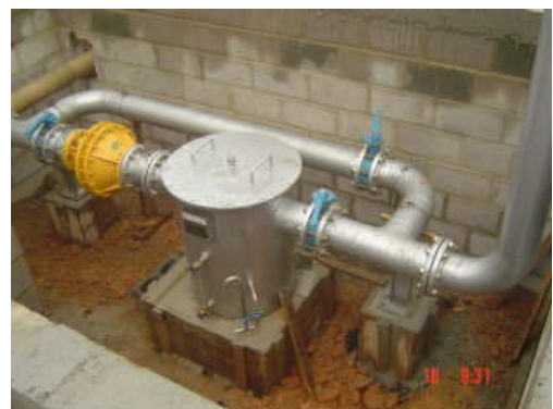
Detalhe do Dreno de Sedimentos.

Possui ainda um sistema de reacendimento automático que no caso da chama apagar faz automaticamente três tentativas de reacendimento alarmando caso a chama não se restabeleça.