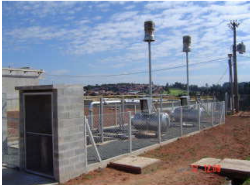
Detalhe de um sistema de queima instalado.

O biogás proveniente dos “Rafas” é conduzido pela tubulação até o sistema de queima, passando pelo separador de sedimentos, pelo medidor de vazão (opcional) e pelo tanque de lastro, chegando a câmara de queima, onde em contato com a chama piloto mantida com GLP proveniente das garrafas (garrafas não fornecidas) é queimado.